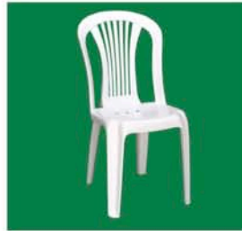
プラスチックチェア