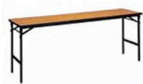
折りたたみ式GSテーブル