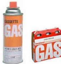
カセットコンロ用ガス