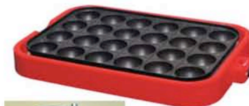
たこ焼きプレート