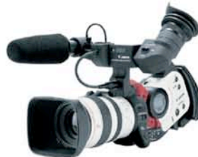
ハイエンドHDビデオカメラ