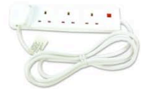
UK電源延長ケーブル