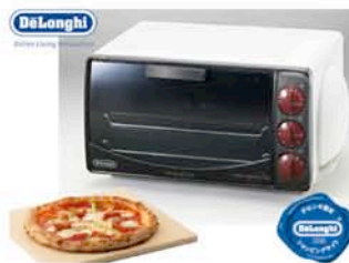
トースターオーブン