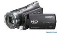
小型HDビデオカメラ