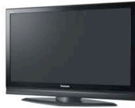
プラズマディスプレイ