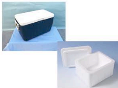
クーラーボックス