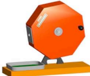
ガラポン抽選セット