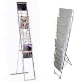
パンフレット用スタンド