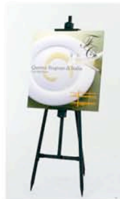
イーゼルスタンド