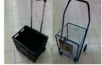
ホイール付きバスケット