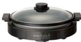
ホットプレート(深型)