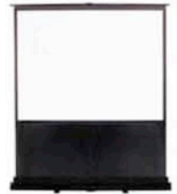
プロジェクター&スクリーン